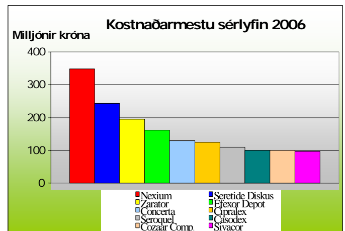
Mynd 2. Kostnaðarmestu sérlyfin hjá TR 2006.

Á síðasta ári var sérlyfið Nexium kostnaðarmesta lyfið fyrir TR og nam kostnaður 348 milljónum kr. Næst á eftir var Seretide Diskus sem kostaði 243 milljónir kr. og þriðja kostnaðarmesta lyfið er Zarator og var kostnaður þess 195 milljónir kr.